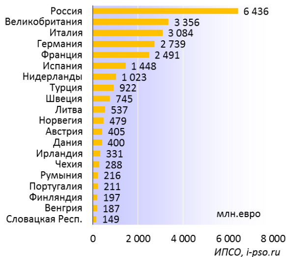
Бюджетные расходы 20-ки крупнейших пенитенциарных ведомств Европы в 2013 г.